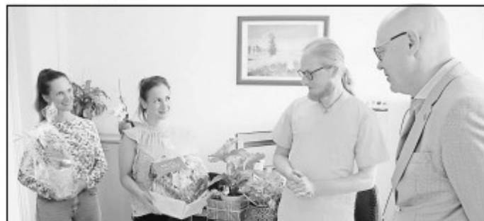
Die Vertreter der KV-Stiftung gratulieren zur Eröffnung.